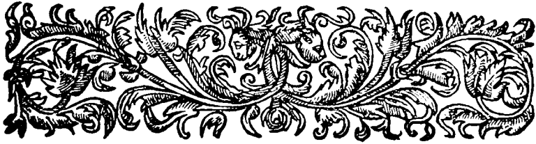
TABLE DES CHOSSES LES PLUS REMARQUABLES

CONTENUES EN CET ŒUVRE, SELON L'ORDRE ALPHABÉTIQUE.